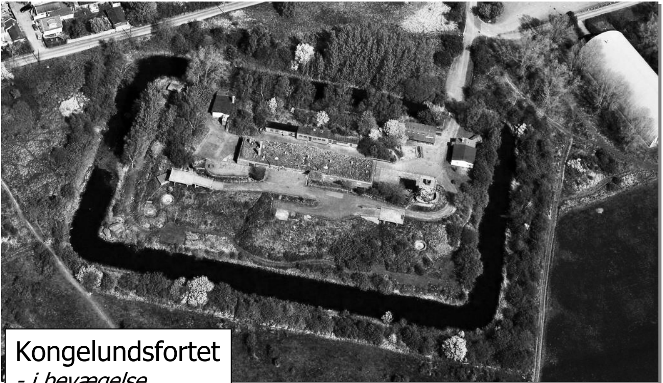
Kongelundsfortet - i bevægelse