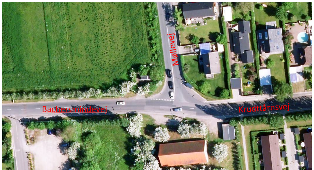
Figur 1: Luftfoto af krydset