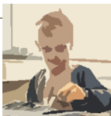
Figur 2: Borger-eksempler på indsatser omfattet af det tværgående højt specialiserede socialområde og specialundervisningsområde.