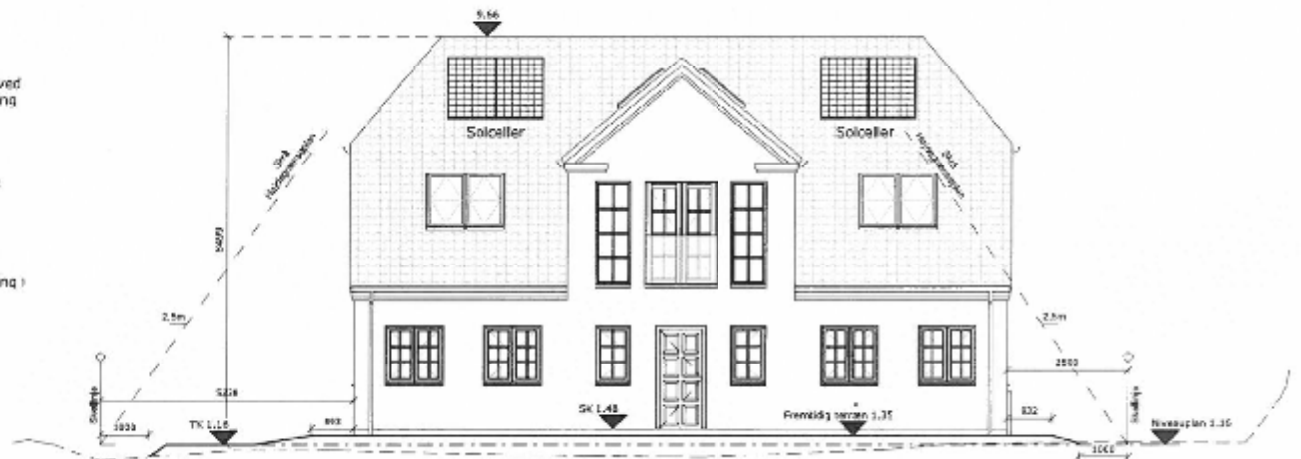
Facade mod øst

Ved udstedt byggetilladelse er viste terrænregulering gældende. Ønsker byggherre, efter byggeriets færdiggørelse, at udføre terrænet anderledes, kræver dette en ny godkendelse hos kommunen. Bemærk evt. krav til terrænregulering i lokalplanen.