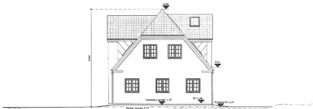
Facade mod syd