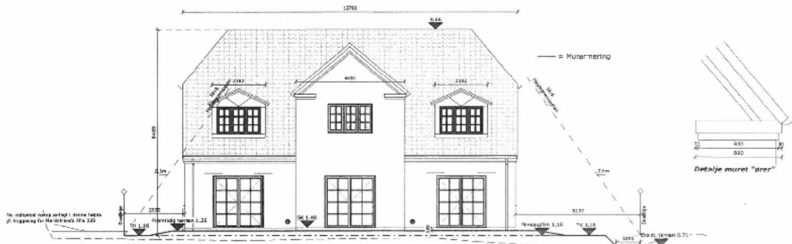
Facade mod vest

Bemærk evt. krav til terrænregulering i lokalplanen.