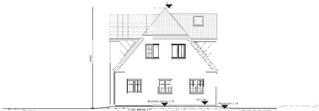
Facade mod syd

Rev. C 13.02.2018 Tagsten ændret MAJ Rev. B 30.01.2018 Kviste udgået og erstattet med ovenlys, skkelkote ændret fra 1.50 til 1.48, MAJ niveauplan tilføjet og terrænregulering tilpasset Rev. A 29.01.2018 Solceller på tagflade mod øst MAJ