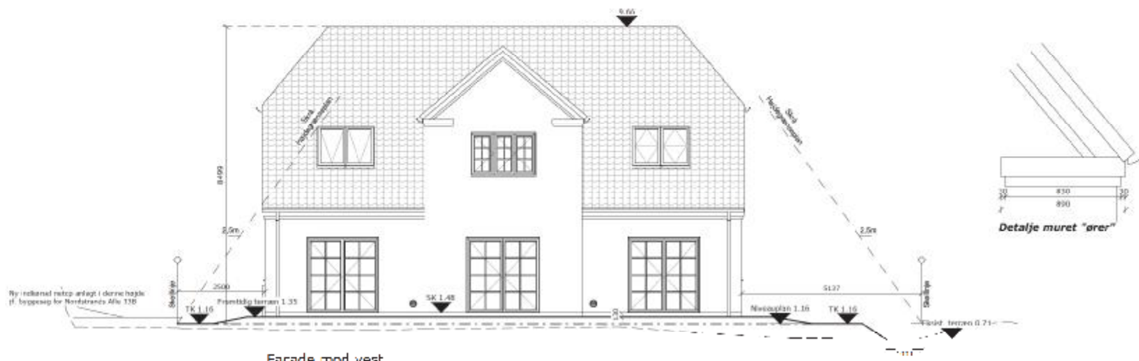
Facade mod vest

Ved udstedt byggetilladelse er viste terrænregulering gældende. Ønsker bygherre, efter byggeriets færdiggørelse, at udføre terrænet anderledes, kræver dette en ny godkendelse hos kommunen. Bemærk evt. krav til terrænregulering i lokalplanen.