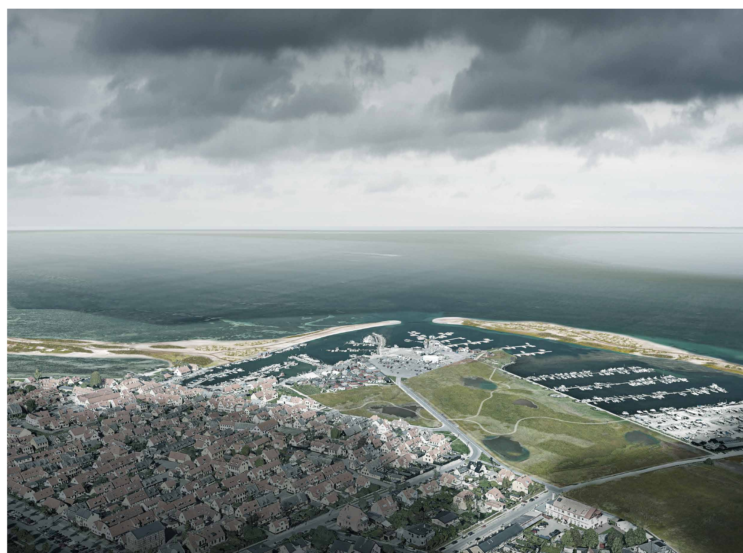
Illustrationen viser et eksempel på, hvordan en løsning udenom havnen kan se ud (ill. Arkitema og COWI)