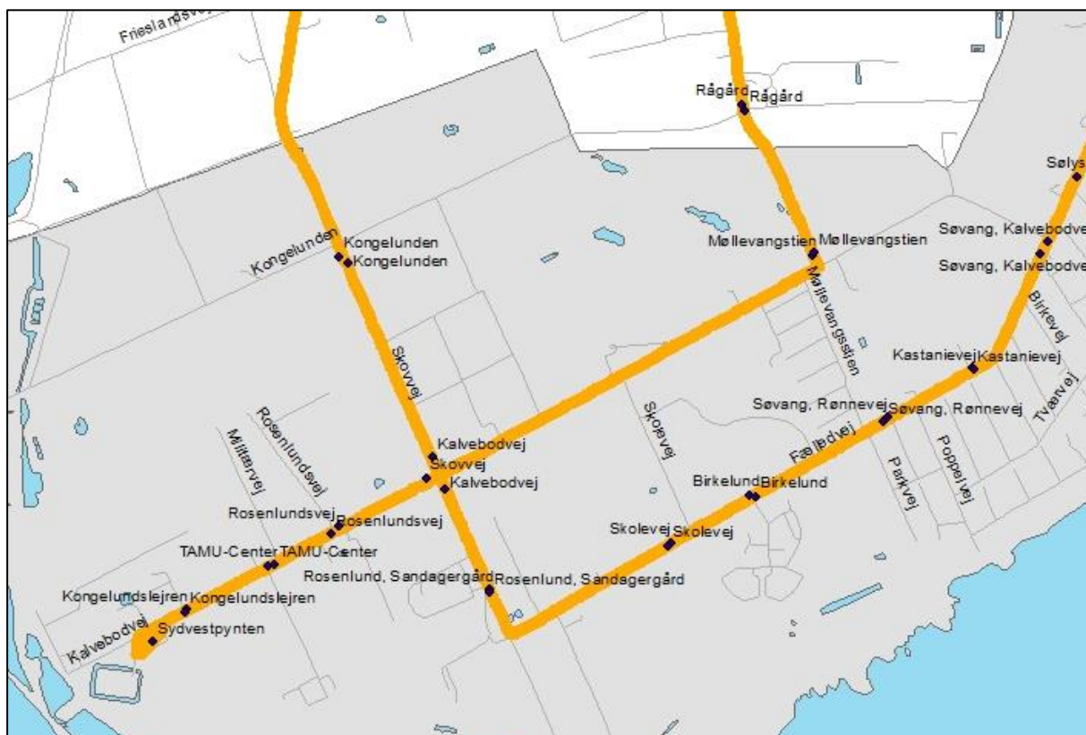
Illustration: Forslag til ny ruteføring af linje 33, hvor hver anden afgang kører ad Tømmerupvej og hver anden ad Kongelundsvej som i dag – med stoppesteder

På plussiden kan stoppet Møllevangstien komme i spil, og hele forbindelsen til Tømmerupvej.