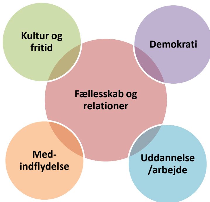
Figur 3 – Indsatsområder på klubområdet

Børnene og de unge i klub vil opleve, at deres hverdag taget afsæt i 5 forskellige indsatsområder. Til trods for at aktiviteterne kan være forskellige fra klub til klub, vil der derfor være en fælles forståelse for det pædagogiske udgangspunkt i Klub Dragør. Nedenstående figur illustrerer de 5 områder, som det pædagogiske arbejde i Klub Dragør tager afsæt i.