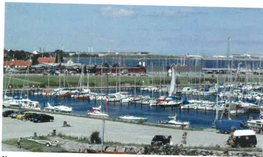
Havneområdet set fra Dragør Fort

Den barriere, som færgehavnen hidtil har udgjort, skal ophæves ved at lade den gamle havn og den nye lystbåde-