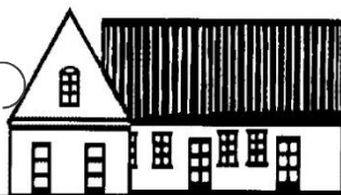
SØLYST Søvej 1A, 2791 Dragør