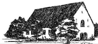
KRUDTHUSET Krudttårnsvej 31, 2791 Dragør