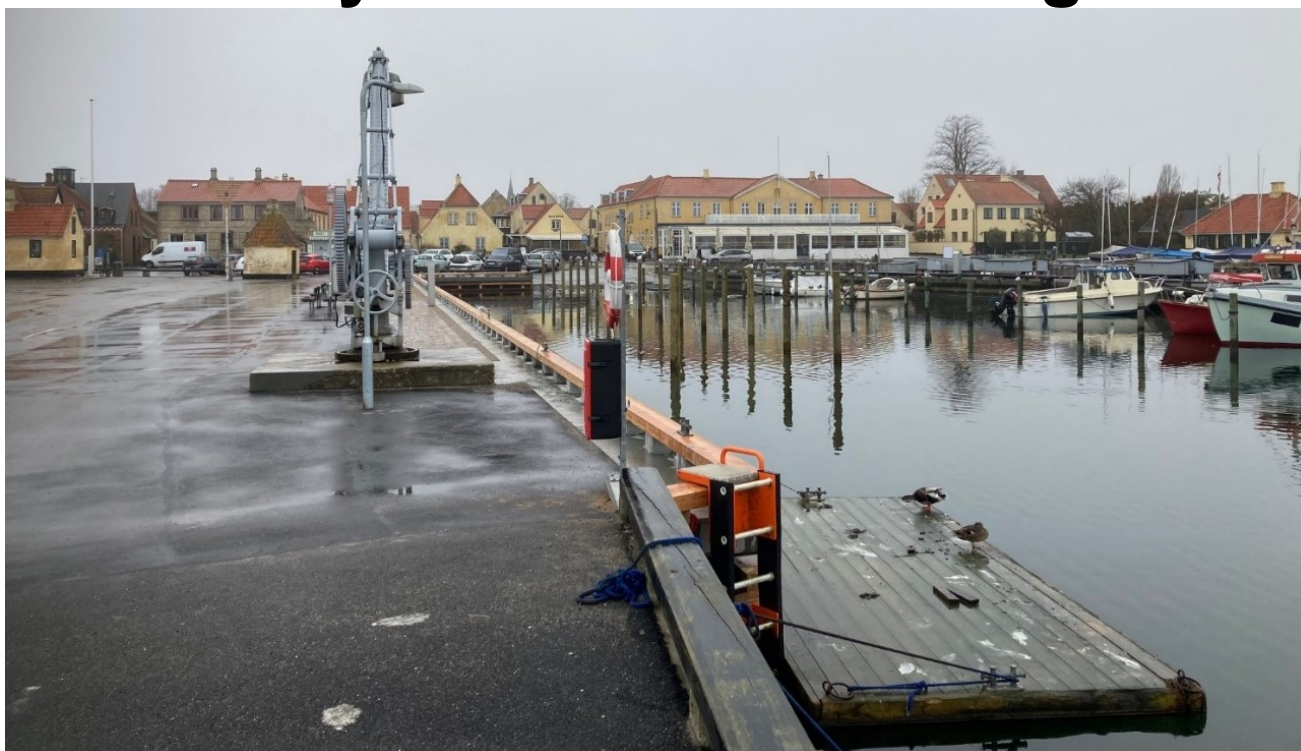
Beghusmolen med ny træhammer og nye pæle