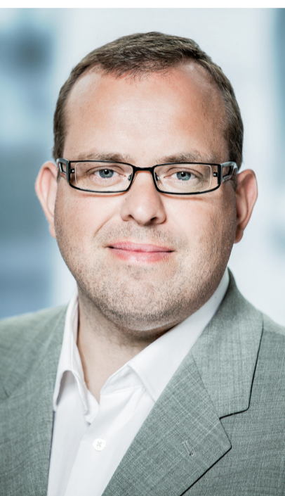
Af borgmester Eik Dahl Bidstrup.