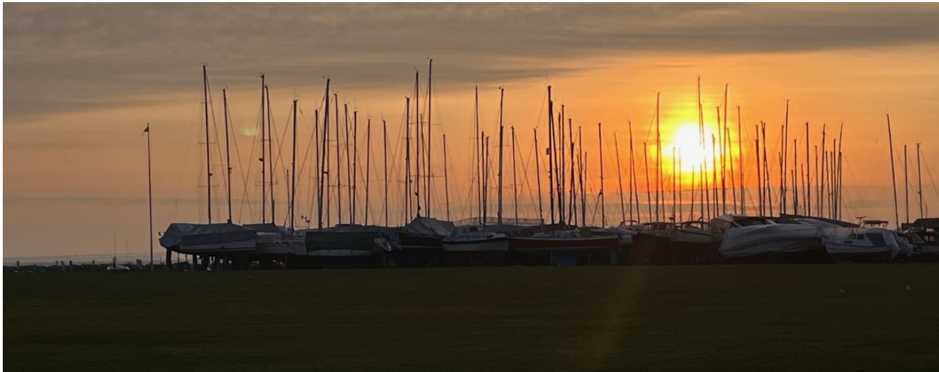
Forårssol over Ny Havn.