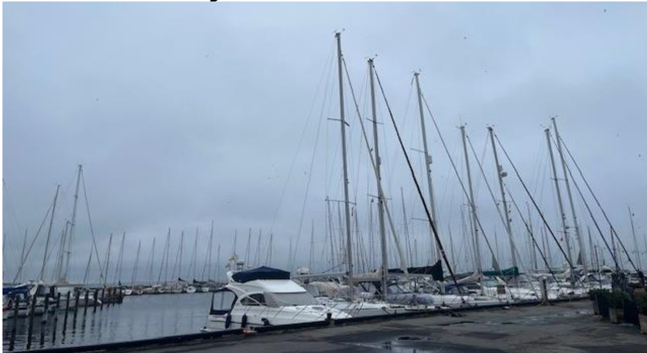
Gæstesejlere i Gammel Havn en august søndag morgen