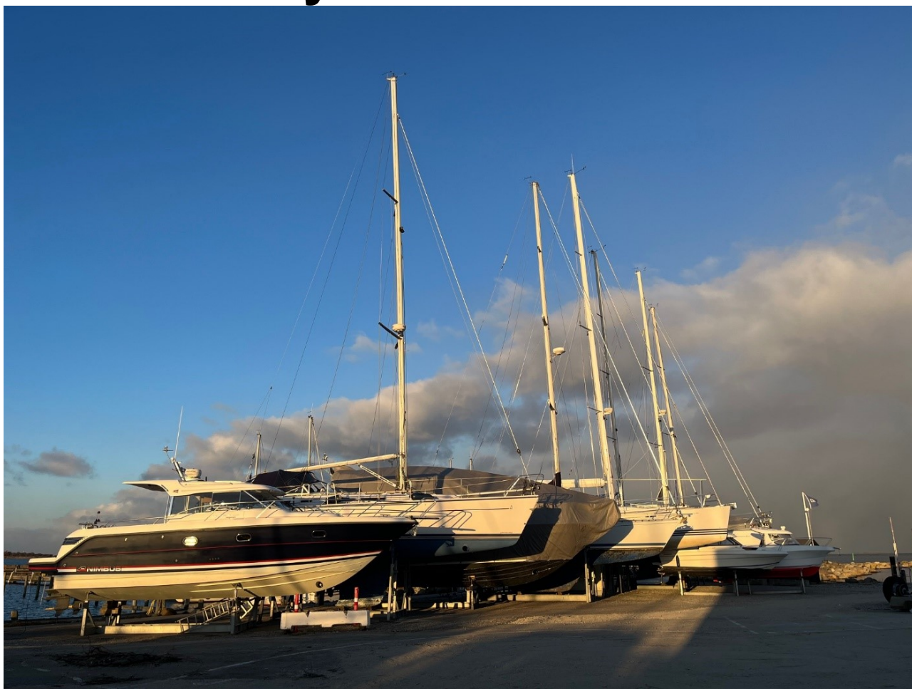
Både på land i den lavt hængende vintersol