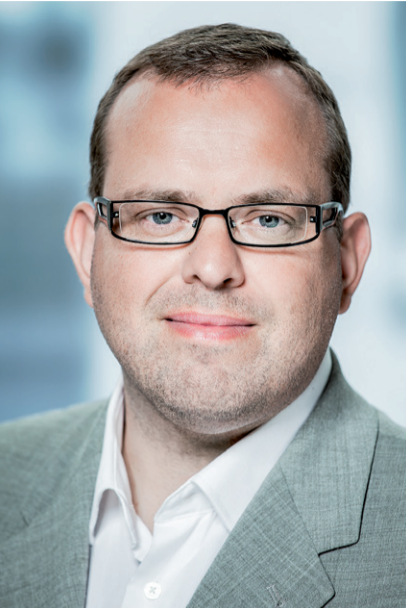
Borgmester Eik Dahl Bidstrup.