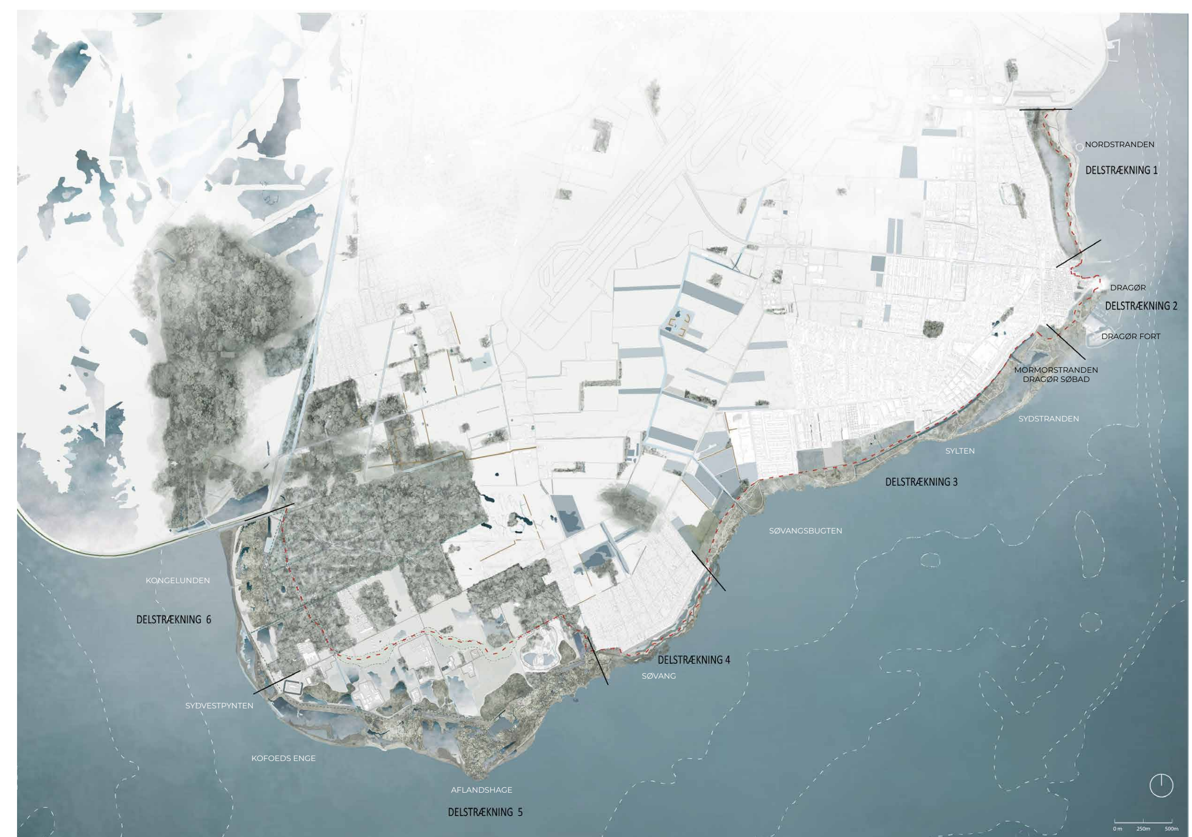
Hovedgreb år 2050 (ill: Arkitema og COWI)

Udviklingsplanen er udarbejdet af rådgiverfirmaerne Arkitema A/S og COWI A/S.