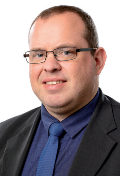
Borgmester Eik Dahl Bidstrup.